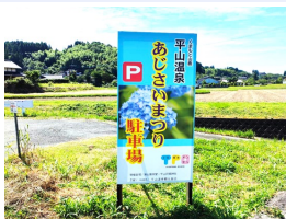
【駐車場】平山めがね橋